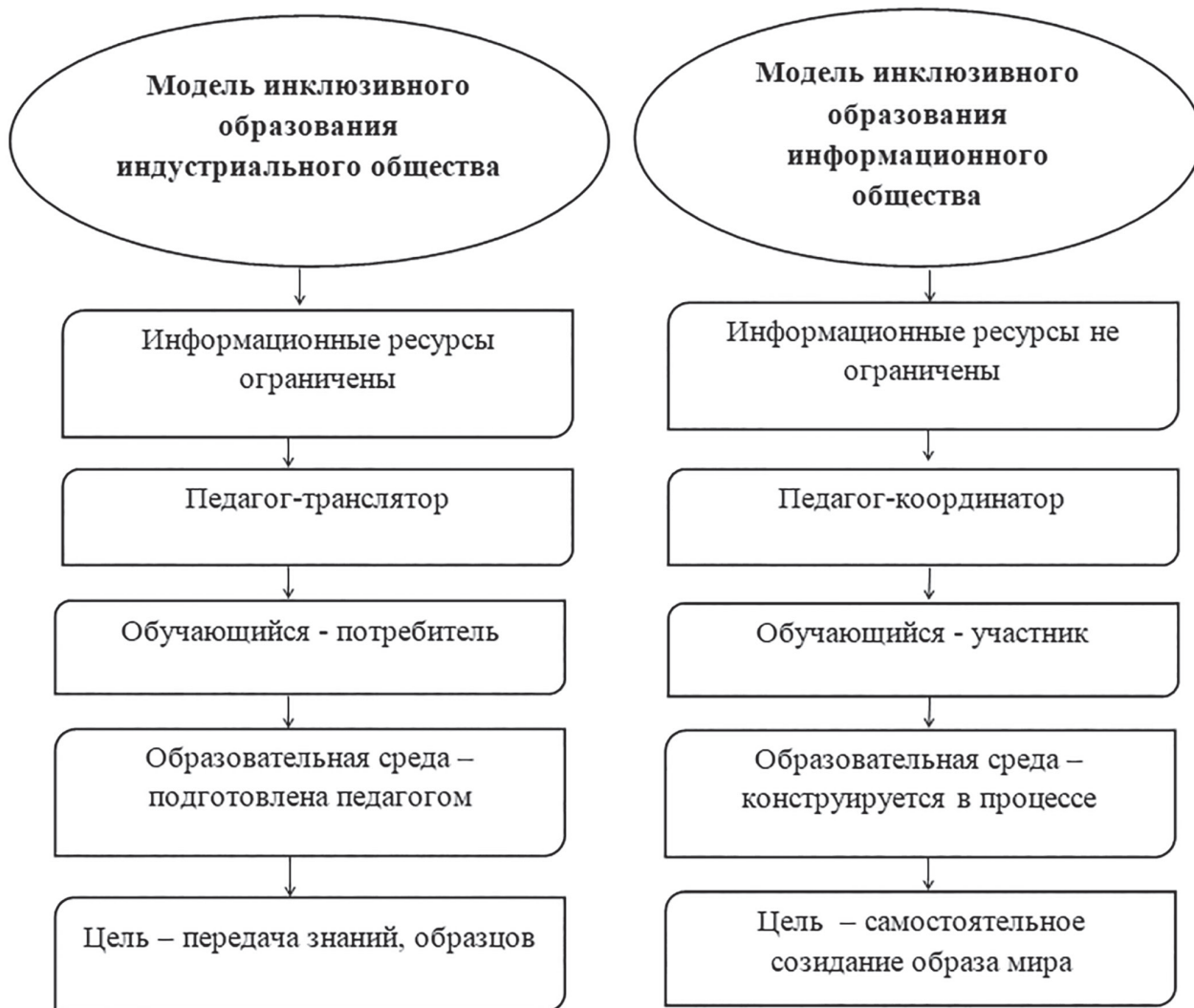
Рис. 1. Сравнение индустриальной и информационной системы образования

В связи с этим следует отметить и изменения при переходе от индустриальной к информационной системе образования. Более наглядно данное сравнение можно представить в виде рисунка (см. рис. 1).