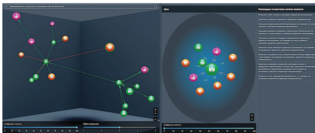
Рис. 3. Интеллектуальная система поддержки принятия решений

Визуально представить несколько вариантов в интерфейсе можно с помощью ветвей шкалы времени. Для выбранного варианта отображается прогноз изменения параметров обстановки, используемых в качестве критериев сравнения альтернатив и выбора решения. Фактически волевой выбор пользователя заключается в подтверждении выбора такого варианта. Однако для этого он должен выполнить определенную работу – сформировать варианты, сгенерировать прогнозы и в случае нехватки информации сформировать соответствующие запросы.