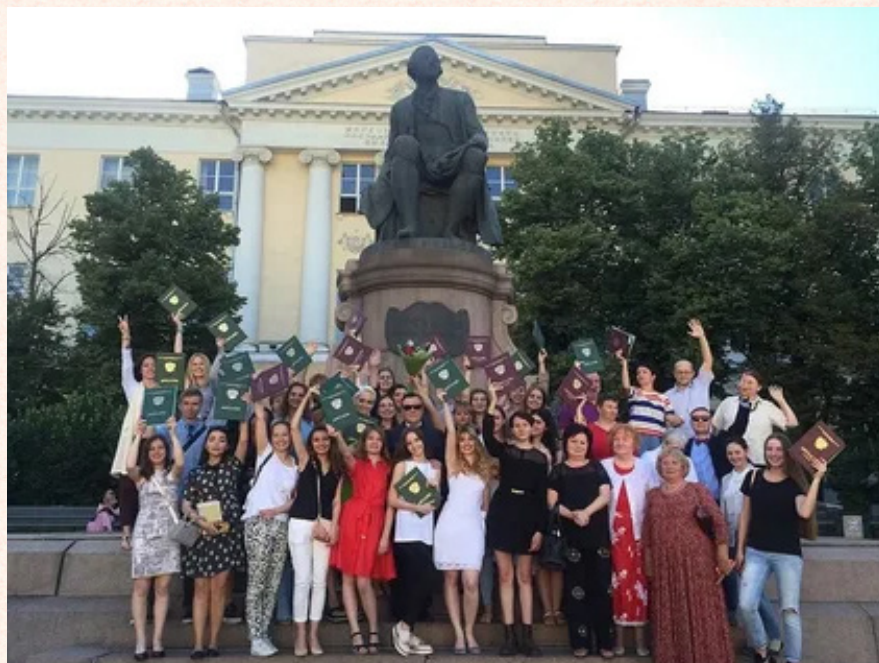
Р и с. 2. Выпускники факультета искусств МГУ им. М. В. Ломоносова F i g. 2. Graduates of the Faculty of Arts of Lomonosov Moscow State University

Факультет искусств в Московском государственном университете им. М. В. Ломоносова, образованный в 2001 г., расположен в отдельном здании – «доме Якоби», памятнике русского классицизма (ул. Большая Никитская, д. 3, стр. 1). В нем одновременно были открыты несколько кафедр: семиотики и общей теории искусства, театрального искусства, музыкального искусства, словесных искусств, а также две лаборатории: художественная (учебная галерея факультета) и театральная (учебный театр факультета) (рис. 2).