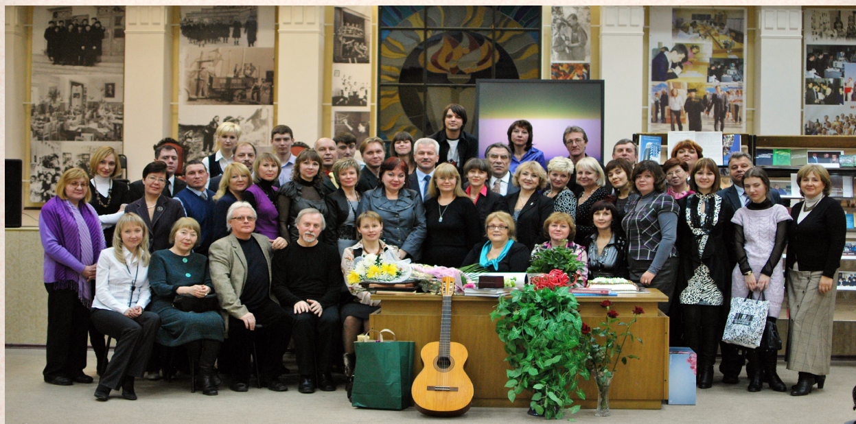
Р и с. 1. Юбилей кафедры культурологии института национальной культуры МГУ им. Н. П. Огарёва. 2010 г.