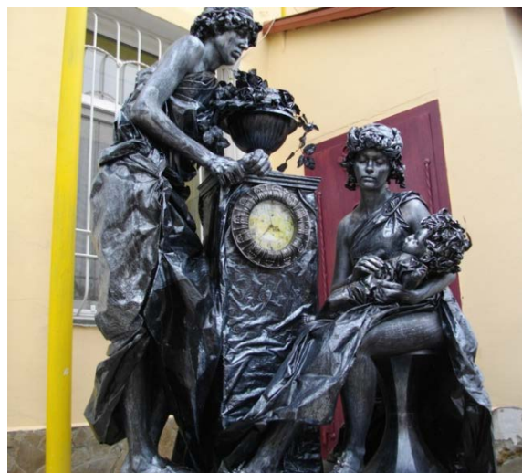
Рис. 1. «Живая скульптура» «Часы»

Практически каждый европейский город считает обязательным появление подобного рода спектаклей на улицах города, так как они не меньшая достопримечательность, чем статичные объекты.