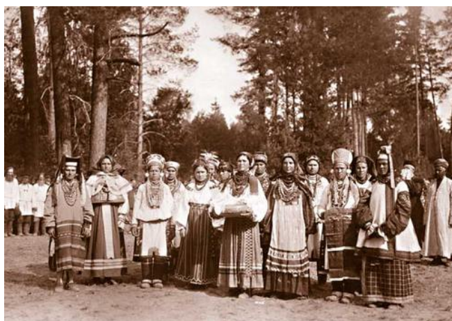
Рис. 12. Сельские жительницы в национальных костюмах Тамбовской губернии во время встречи императора Николая II. Фотография 1903 г.