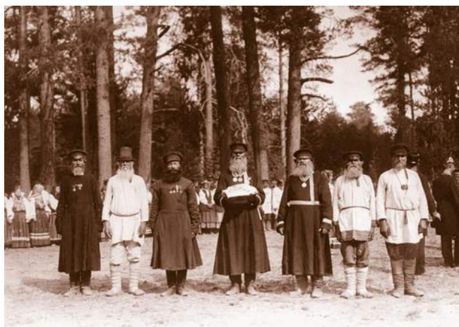
Рис. 13. Сельские старосты с хлебом – солью.