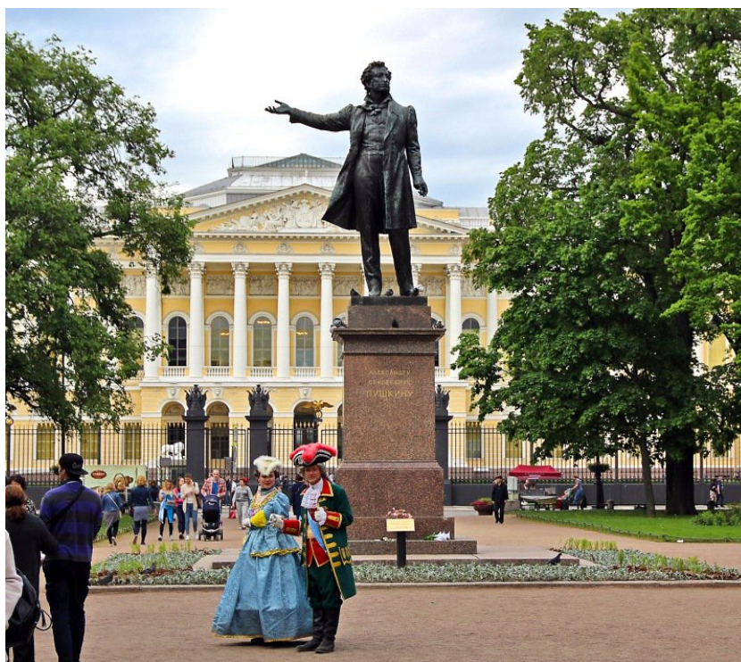
Рис. 15. Памятник Пушкину на площади Искусств в Санкт-Петербурге работы М. Аникушина