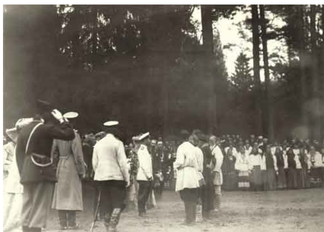
Рис. 14. Николай II и жители в национальных костюмах на границе Нижегородской и Тамбовской губерний. Фотография 1903 г. РГИА