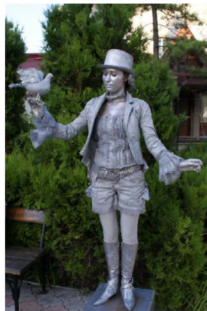
Рис. 2. Фигура «живой скульптуры»