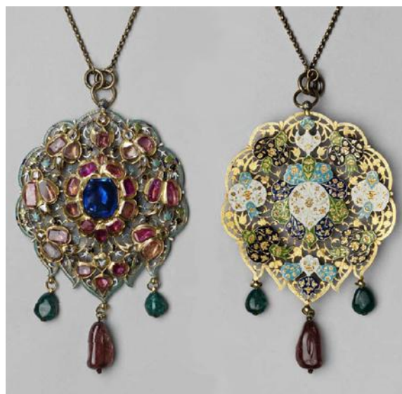
Рис. 8. Запона-подвеска царя Алексея Михайловича. Стамбул, вторая половина XVII в.

Все эти предметы Николай II поручил выбрать своим дяде и тёте. Из дневников Сергея Александровича: «В 1/2 3 ч. с женой в Оружейную палату и выбирали старинные вещи для костюма Ники» [5]. Из телеграммы Сергея Александровича Николаю от 28 января 1903 г.: «Мы выбрали в Оружейной палате всё, что Ты приказал; надеюсь, останешься доволен» [5].