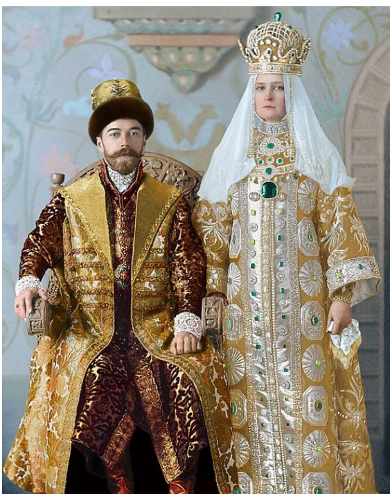
Рис. 7. Николай II и Александра Фёдоровна