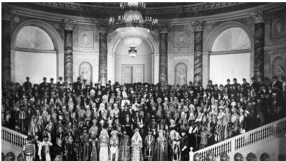
Рис. 9. Костюмированный бал 1903 г.