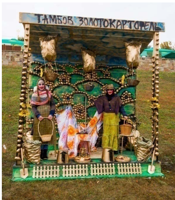
Рис. 3. Подиум с фигурами «Тамбов золотокартофельный»

Была проведена тщательная подготовка: сделан проект, основной задачей которого было показать, что картошка – это не просто продукт, но она может быть также и художественным материалом. В результате появился подиум с силуэтом Тамбова, сделанным из картофеля, покрытого золотой краской, что символизировало необходимость и важность данного продукта для региона. Здесь же были представлены и продукты, сопутствующие сбору урожая. Кроме того, для оживления данной композиции были использованы впервые в Тамбове так называемые «живые» скульптуры сборщиц картофеля.