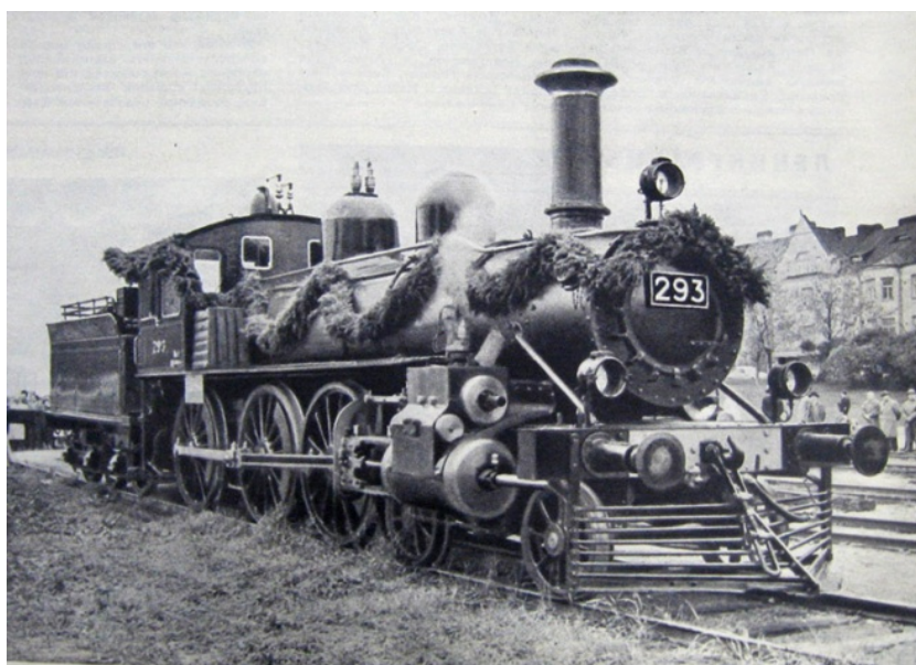
Рис. 16. Паровоз № 293 перед отправкой в Россию