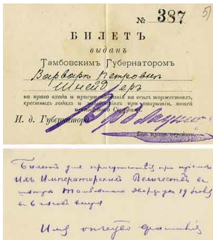
Рис. 10. Фото билета В.П. Шнейдер, позволявшего присутствовать на богослужениях, крестных ходах и молебнах во время Саровских торжеств. 1903 г. Бумага, печать, чернила. ИРЛИ (Пушкинский Дом)