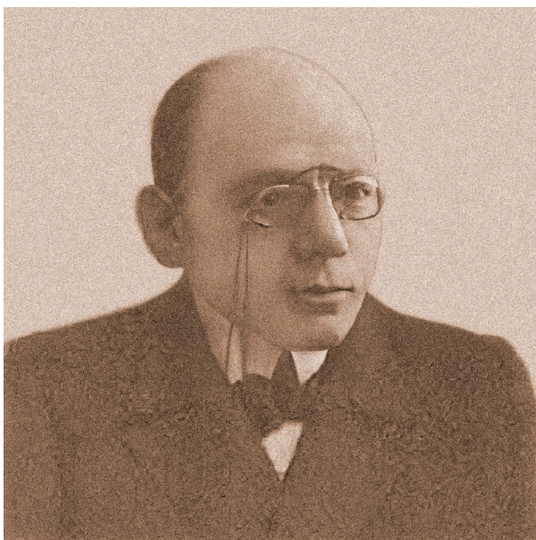
Ил. 4. Аркадий Георгиевич Горнфельд. Фото, 1900-е гг. ЭСБЕ. Портретная галерея редакторов и сотрудников

гивает гораздо более широкие и универсальные характеристики данного направления, небезразличные для его исследования и в практике мастеров пластических искусств. При этом текст Горнфельда скорее напоминает некое критико-эстетическое эссе, нежели строго выдержанную энциклопедическую статью, что, однако, не умаляет её достоинств. Так, раздел открывается поистине значимой декларацией: «Во всяком произведении изящной словесности мы различаем два необходимых элемента: объективный – воспроизведение явлений, данных помимо художника, и субъективный – нечто, вложенное в произведение от себя» [5, с. 402]. Совершенно очевидно, что замена «изящной словесности» на более обобщённое «изящных искусств» нисколько не исказит смысла сказанного и не погрешит против истины.