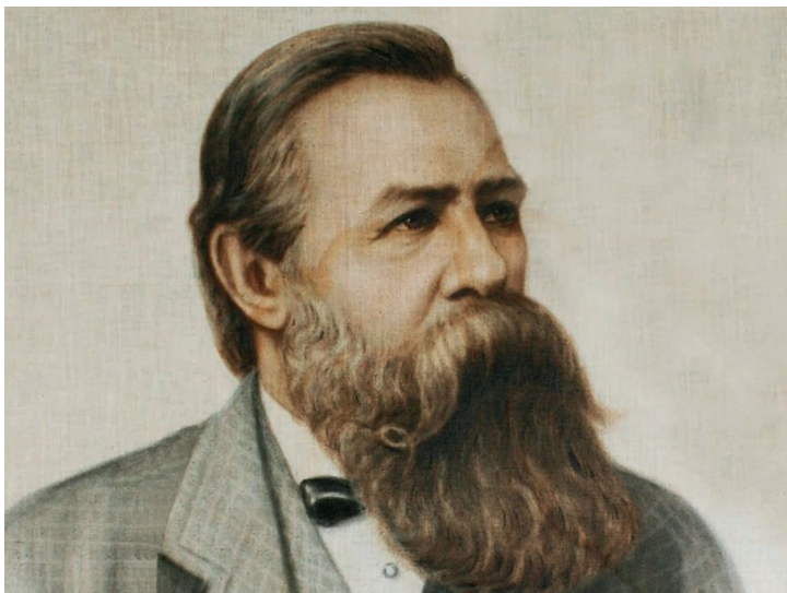
Ил. 2. Фридрих Энгельс. Портрет по фото 1879 г.

значениях и не имеющий ничего общего с Р[еализмом] в искусстве, в педагогике и т.п.» [5, с. 401]. Таким образом, данный раздел закономерно выпадает из сферы нашего внимания.