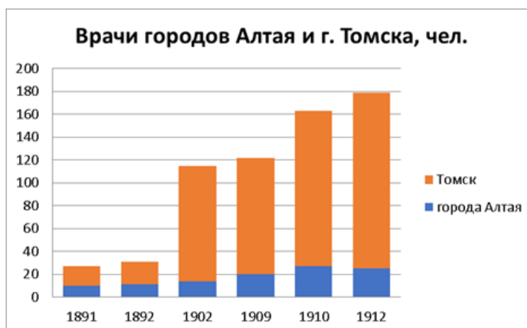
Рис. 5. Численность городских врачей Алтая и г. Томска

Сравнение количества врачей в губернском городе Томске и окружном городе Барнауле свидетельствует о существенно большем их представительстве в центре губернии (Прил. 5). Так, в 1896 г. население Томска было больше населения Барнаула в 1,7 раза, а количество врачей – в 7,3 раза. В Томске на 1 врача приходилось 1137 жителей, а в Барнауле – 4901. К 1912 г. ситуация несколько изменилась: население Томска стало больше населения Барнаула в 2,3 раза, а количество врачей – в 8,6 раза. При этом в Томске на 1 врача теперь приходилось 699, а в Барнауле – 2558 жителей, что свидетельствует о количественном улучшении в обоих городах, несмотря на рост населения [11: 22] . В целом приведенные цифры можно оценить как достаточно корректные, однако нельзя исключать фактор более детального учета врачебного персонала в главном городе губернии, в то время как относительно Барнаула представлена статистика только по врачам гражданского ведомства без учета вольнопрактикующих врачей. Существенная разница между городами Алтая вместе взятыми и Томском по количеству врачей представлена на рис. 5.