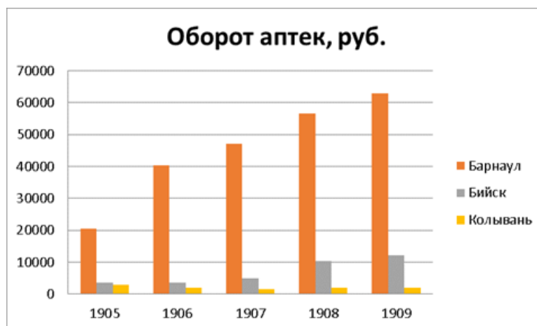
Рис. 1. Оборот аптечной сети в городах Алтая и Томске (1905–1909 гг.).