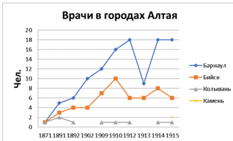
Рис. 4. Численность городских врачей Алтая (1871–1915)

можно отметить, что общее число врачей городов Алтая во временном разрезе с 1871 по 1915 гг. в целом растет, что связано с открытием новых лечебных заведений, появлением вольнопрактикующих врачей и командированных от Министерства внутренних дел в губернию (Рис. 4). При этом количество врачей, как представляется, напрямую зависело от численности населения того или иного города: в Барнауле оно приближалось к 20, в Бийске – к 10, в Колывани было 1–2 врача, а в Камне врачи появились лишь в 1915 г., вместе с присвоением ему статуса города.