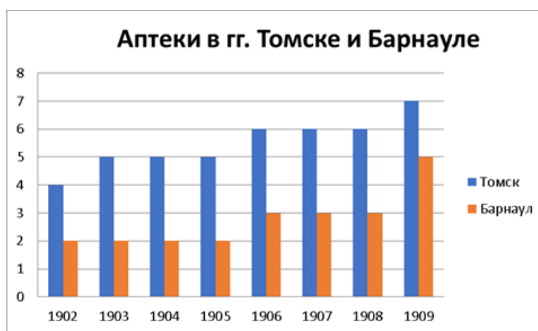
Рис. 2. Развитие аптечной сети в Томске и Барнауле (1902–1909 гг.).