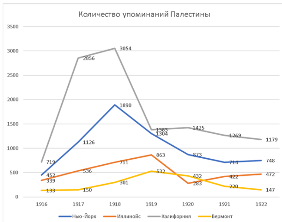
Рис. 2. Количество упоминаний слова "Палестина" в штатах Нью-Йорк, Иллинойс, Калифорния, Вермонт за 1916 - 1922 гг.

Решение второй задачи (сравнение статистических показателей 1918 года с предшествующим и последующим историческим периодом) целесообразно осуществить на примере штатов с наибольшими показателями цитирования, но различной политической направленности (и республиканской, и демократической). Для такого анализа были отобраны статьи о Палестине из четырех штатов (Калифорния, Нью-Йорк, Вермонт, Иллинойс) за период с 1916 по 1922 гг. Первые два штата в указанное время представляли, в большей степени, демократический взгляд на международные отношения, а Вермонт, Иллинойс – республиканско-изоляционистский. Построенный нами график упоминаний Палестины в газетах данных штатов сразу это подтвердил: их общее количество в республиканских штатах более чем в два раза ниже (например, 7107 в Нью-Йорке при 3326 в Иллинойсе за весь период). Изоляционистские газеты в 1916 – 1922 гг. проявляли существенно меньший интерес к ситуации на Ближнем Востоке, чем интернационалистские. (рис. 2).