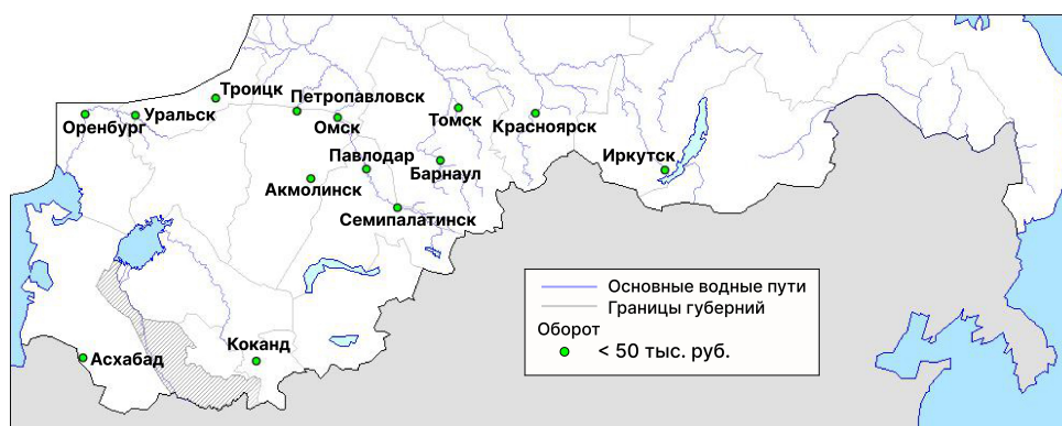
Рисунок 3. Географические связи векселей, учтенных в Московском отделении ПМКБ в Азиатской России. Оборот (сумма выписанных и оплаченных векселей), в тыс. руб.