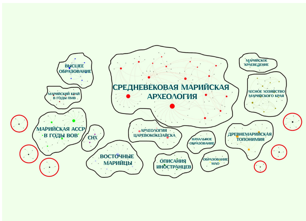
Рис. 2. Тематические кластеры на сетевом графе

В результате построения социально-сетевой модели, визуализирующей систему научной коммуникации в изучаемой предметной области российской историографии, мы выявили тринадцать крупных кластеров публикаций (наиболее популярных тематик исследований), каждый из которых имеет в своем составе минимум 2–3 научные статьи, выделенных на графе одинаковым цветом, и обозначен своим названием (носящим, во многом, исключительно исследовательский характер). К ним также примыкают ряд отдельных «периферийных» кластеров, представленных на графе только одной научной публикацией (обозначены красным цветом). Все выделенные «субобласти» графа достаточно автономны друг от друга, но при этом тесно связаны цитированиями внутри себя. Для выделения этих кластеров наилучшим образом подошла укладка «Yufan Hu Proportional», основанная на связях узлов графа друг с другом и силе этих связей, с начальным размером шага в 20 единиц (см. Рис. 2). Основное преимущество алгоритма Yufan Hu состоит в том, что он дает более быстрые результаты по сравнению с другими методами, сосредоточив внимание на притяжении и отталкивании узлов, расположенных по соседству (а не делая расчёт для всей сети). Это позволяет исследователю обработать относительно большие графы и получить лучшую оптимизацию расстояний между внешними и центральными узлами.