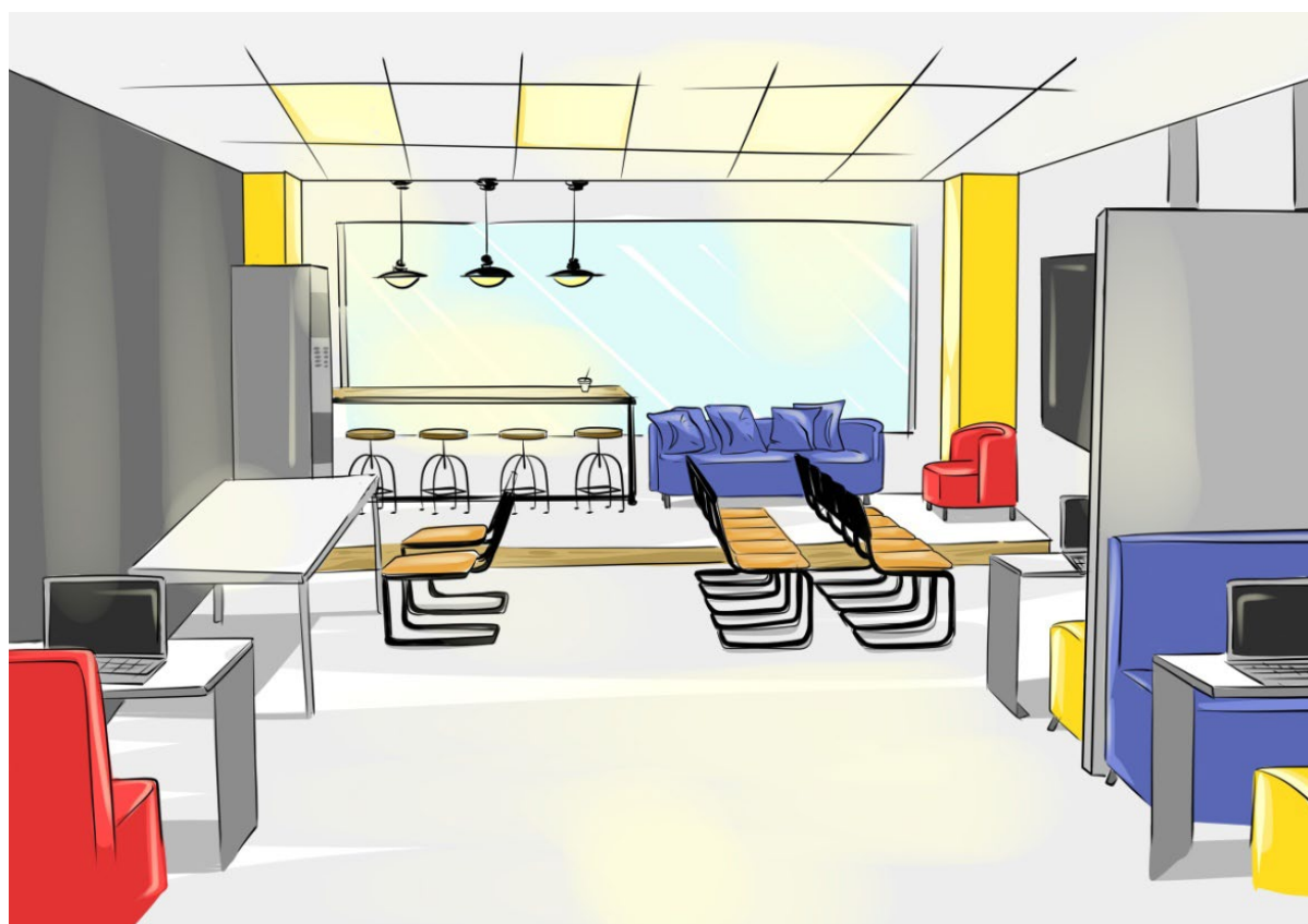
Рис. 1. Эскиз основной идеи Fig. 1. The main idea's sketch

Иллюстративным примером применения утилитаристского подхода может служить авторская разработка многофункционального творческого пространства (коворкинга) (рис. 1–4).