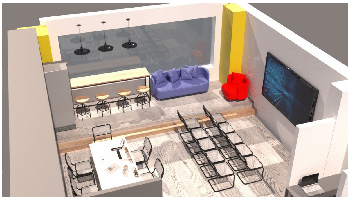
Рис. 4. 3D-визуализация многофункционального творческого пространства Fig. 4. 3D visualization of a multifunctional creative space

Разработка представляет собой дизайн-проект и философию с функциональным насыщением пространства. Создание дизайнерских пространств для креативной деятельности в настоящее время является одним из наиболее востребованных. Площадка предназначена для проведения мероприятий (творческих встреч, круглых столов, мастер-классов и т. п.). Предусмотрены зоны как для командной, так и индивидуальной работы, пространство для отдыха. Поскольку пространство предназначено для осуществления эффективной коммуникации, важным моментом является возможность трансформации, формирования зон для определенных целей, что осуществляется