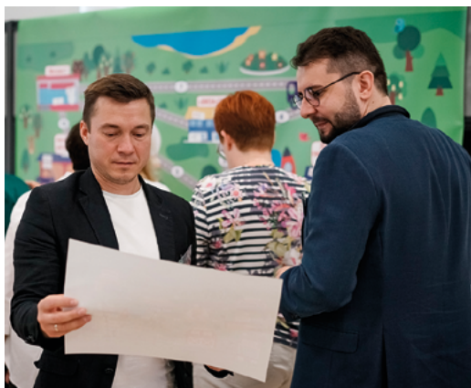
Занятие программы «Навыки эффективного руководителя в сфере управления территорией»

Работа в социальных сетях и взаимодействие с жителями через мессенджеры оказались одними из самых востребованных тем в аудитории. В период пандемии все встречи, все взаимодействия с жителями проходили в цифровом формате. Вынужденная смена способов коммуникации сделала социальные сети и чаты одним из основных каналов общения. Сегодня чаты с жителями становятся обязательной составляющей работы сотрудников