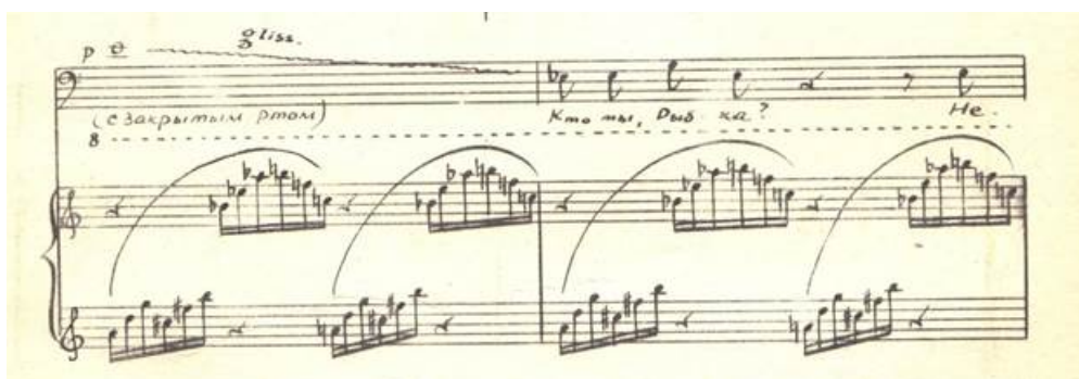
Рисунок 1. К. Молчанов. Вокальный цикл «Из черной шкатулки».