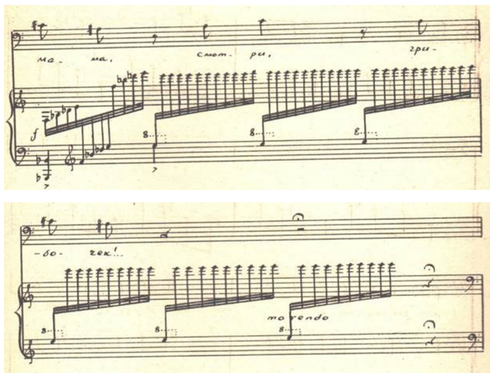
Рисунок 3. К. Молчанов. Вокальный цикл «Из черной шкатулки».

Выразителен подразумеваемый диалог, который звучит в конце эпизода «Солнышко». Фразу ребенка «мама, смотри, грибочек» певец исполняет говорком, причем слова «мама, смотри» – тревожно, f , а «грибочек» – растеряннo, шепотом. Яковенко очень точно интонацией голоса передает состояние ребенка, увидевшего ядерный «гриб» в небе после взрыва атомной бомбы (рисунок 3).