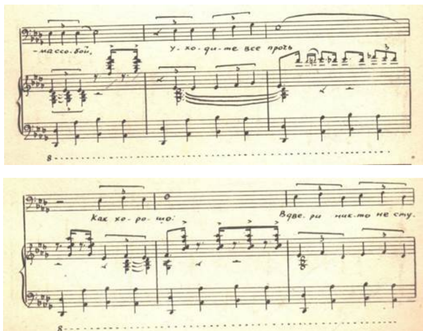
Рисунок 2. К. Молчанов. Вокальный цикл «Из черной шкатулки».