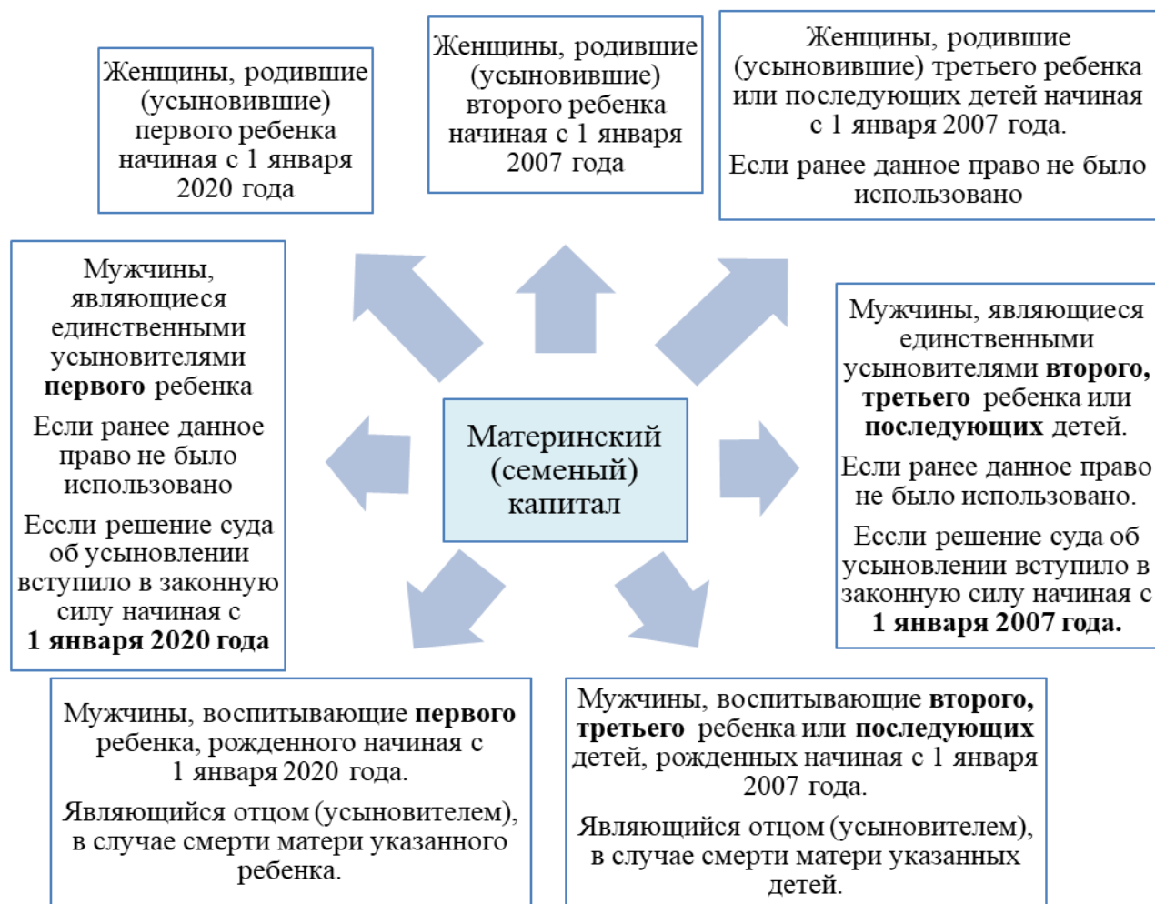
Рис. 1. Категории граждан, имеющих право на получение материнского капитала

Начиная с 15 апреля оформления сертификата на МСК происходит в автоматическом режиме. Уведомление о приобретении семейного права на МСК поступает в личный кабинет на портале Госуслуг. Для использования этих средств семье достаточно получить электронную справку, избегая необходимости подачи декларации.