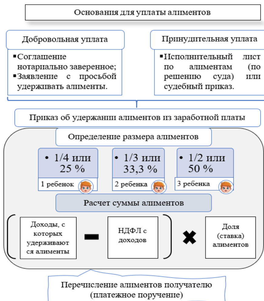
Рис. 5. Алгоритм документального отражения операций по исполнительным листам (алименты)