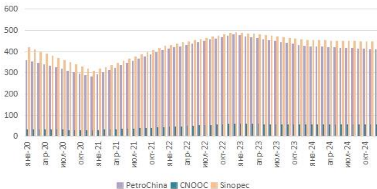
Рис. 2. Выручка компаний PetroChina, CNOOC и Sinopec, 2020-2024 гг., млрд долл. США

Далее рассмотрим рисунок 2, на котором отражена динамика выручки компаний PetroChina, CNOOC и Sinopec в абсолютном значении.