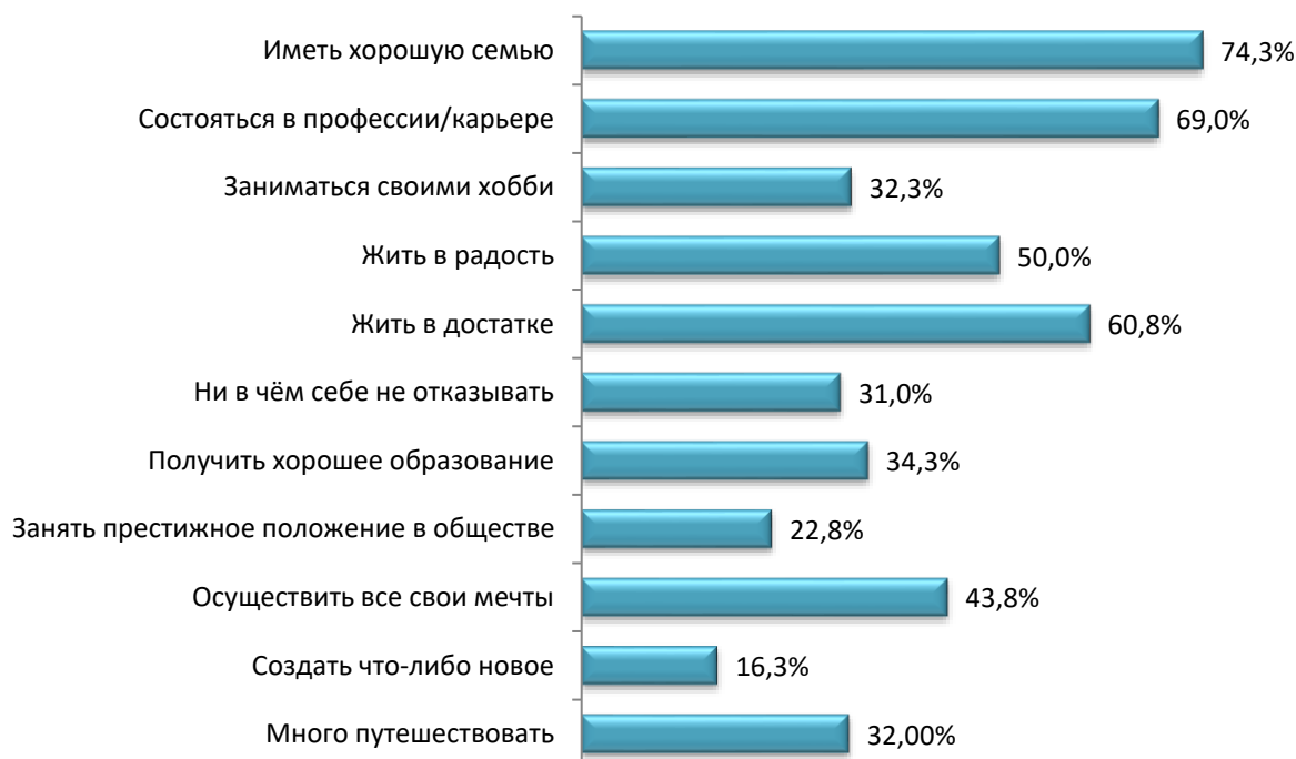
Рис. 1. Распределение ответов на вопрос «Какие из вариантов в большей степени отражают Ваши цели в жизни? (возможно до трех вариантов ответа)», % ( n = 400 )

лизации, внутреннему комфорту и удовлетворенности жизнью. Таким образом, наряду с внешними формами успеха для студентов важны и личные ощущения счастья и свободы. Менее значимыми оказались цели, связанные с социальным престижем и инновационной деятельностью: лишь 22,8 % отметили желание занять престижное положение в обществе и 16,3 % – стремление создать что-либо новое. Относительно низкий процент по этим пунктам говорит о том, что социальный престиж и новаторство не являются массовыми ориентирами. Возможно, это отражает реалистичный подход студентов к жизни, понимание сложности достижения подобных целей или снижение значимости внешнего социального признания. Также в открытых ответах респонденты указывали цели альтруистического и гуманистического характера, такие как желание «повлиять на людей», «сделать мир лучше» или «оставить приятный след в истории». В совокупности эти данные отражают баланс между традиционными и индивидуалистическими установками в системе жизненных ценностей современной студенческой молодежи (рис. 1).