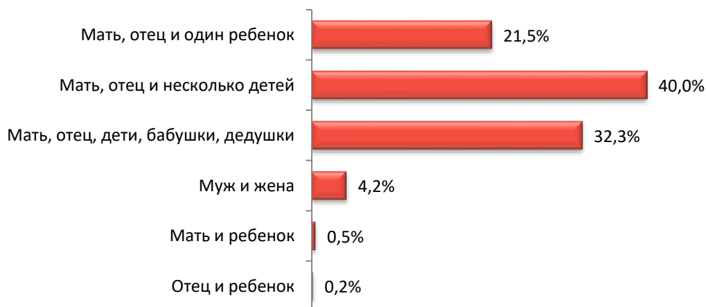
Рис. 2. Распределение ответов на вопрос «Как, по Вашему мнению, должна выглядеть современная семья?», % ( n = 400 )

Анализ ответов на вопрос «Как, по Вашему мнению, должна выглядеть современная семья?» позволил выявить доминирующие представления студентов о семейной модели. Наиболее предпочтительной моделью и сегодня остается традиционная нуклеарная семья с несколькими детьми (отметили 40 % респондентов). Второе место по популярности занимает расширенная семья, включающая бабушек, дедушек и детей (32,3 %). Это говорит об устойчивости представлений о ценности родственных связей и многопоколенной семейной структуре. Однако 21,5 % студентов (каждый пятый опрошенный) предпочли модель семьи с одним ребенком, что может быть связано, например, с экономическими факторами. Значительно меньшую поддержку получили модели «мать и ребенок» (0,5 %) или «отец и ребенок» (0,2 %), указывая на низкую популярность идеи неполной семьи как нормы (рис. 2). Нами были проанализированы индивидуальные варианты ответов студентов, которые продемонстрировали гибкость понимания семьи, акцентируя внимание на личном выборе и эмоциональной связи между партнерами, а не на количестве детей или формальных ролях. Формулировки типа «двое партнеров, которые любят друг друга», «современная семья никому ничего не должна», «каждый сам решает» отражают влияние постмодернистских и постматериалистических ценностей, связанных с индивидуализмом, равноправием и свободой выбора.