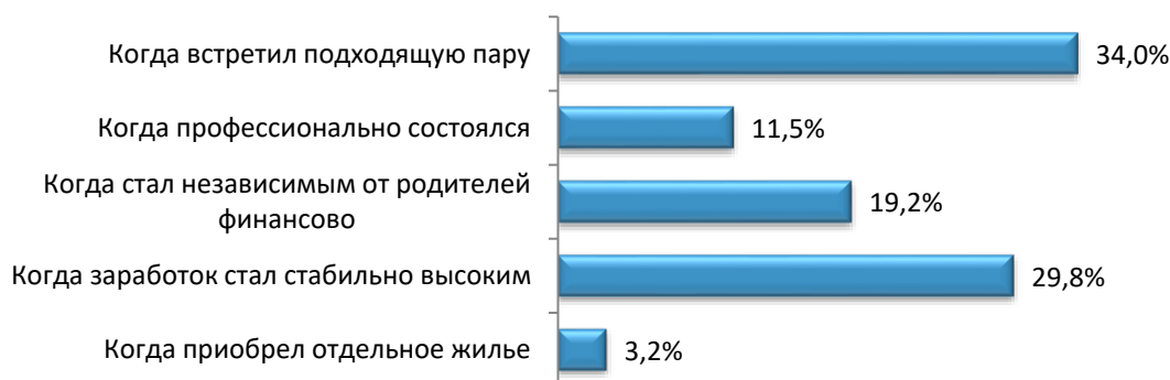
Рис. 3. Распределение ответов на вопрос «Когда, по Вашему мнению, человек должен создавать свою семью?», % ( n = 400 )

Эти данные могут на первый взгляд показаться противоречивыми по сравнению с ответами на вопросы, в которых семья занимала лидирующее место среди жизненных целей и ценностей. Можно предположить, что под «ценностью» и «жизненной целью» молодые люди понимают разные вещи, они по-прежнему рассматривают семью как важную часть своей жизни, но не как абсолютный приоритет в условиях современного общества, где акцент все чаще делается на личностное развитие, карьеру, финансовую независимость и самореализацию. Выбор «семья – не главная ценность» не обязательно указывает на отрицание важности семьи, а может отражать переоценку и изменение иерархии ценностей, характерную для постматериалистического поколения. Таким образом, анализ полученных данных выявил диалектическое отношение современной молодежи к семье: с одной стороны, семья продолжает сохранять свое важное место в системе ценностей, с другой – уступает первенство в повседневных установках таким аспектам, как личная свобода, карьерный рост и эмоциональное самочувствие.