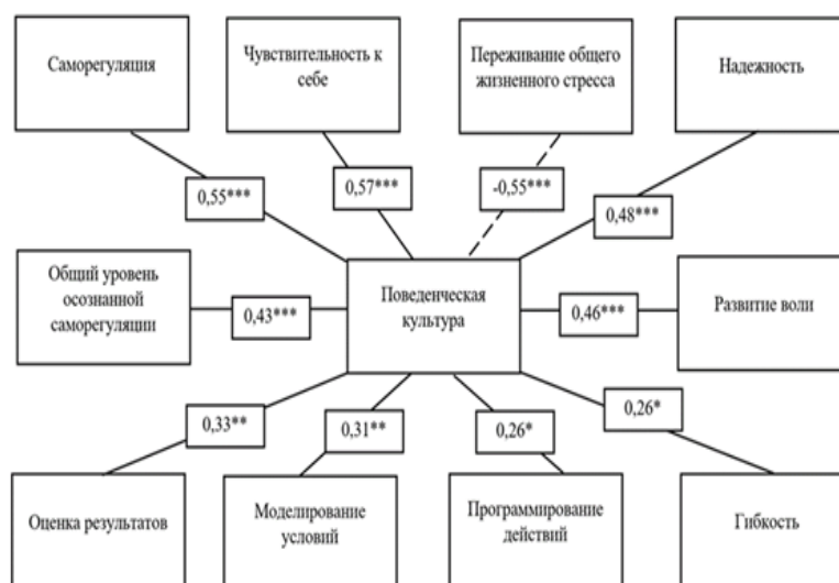
Рис. 2. Корреляционная плеяда значимых взаимосвязей параметра «Поведенческая культура» («Методика исследования конфликтологической культуры») и параметров методик «Методика исследования самоуправления» и «Стиль саморегуляции поведения»

* – p < 0,05 ; ** – p < 0,01 ; *** – p < 0,001