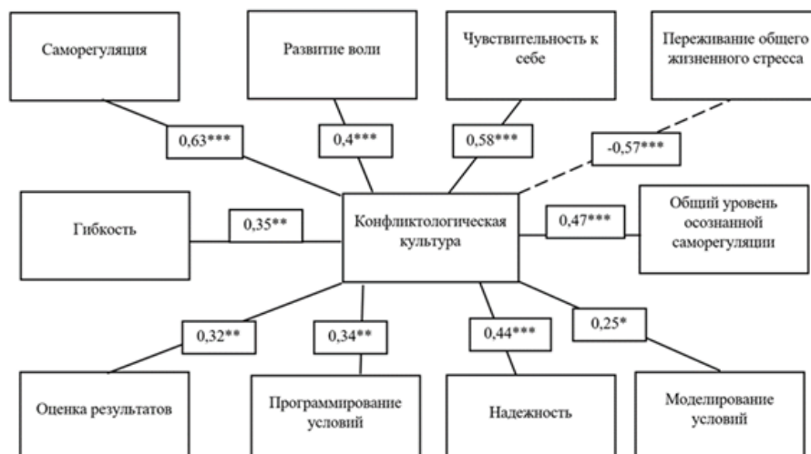
Рис. 1. Корреляционная плеяда значимых взаимосвязей параметра «Конфликтологическая культура» («Методика исследования конфликтологической культуры») и параметров методик «Методика исследования самоуправления» и «Стиль саморегуляции поведения».

Примечание: на рисунках присутствуют следующие обозначения уровня значимости корреляций: