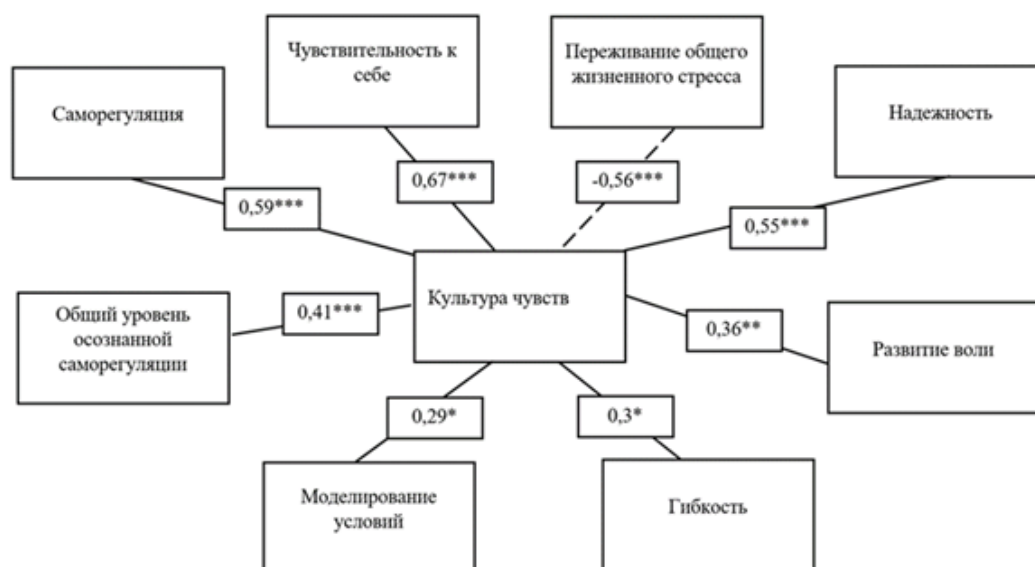
Рис. 3. Корреляционная плеяда значимых взаимосвязей параметра «Культура чувств» («Методика исследования конфликтологической культуры») и параметров методик «Методика исследования самоуправления» и «Стиль саморегуляции поведения»

Наиболее сильная и высокая по значимости взаимосвязь наблюдается с параметром «Чувствительность к себе». Возможно предположение, что развитие чувствительности к себе может выступать основой и ресурсом саморегуляции для развития культуры чувств, равно как и наоборот – развиваться при осознании ценности культуры чувств в конфликте и стремлении к ее становлению.