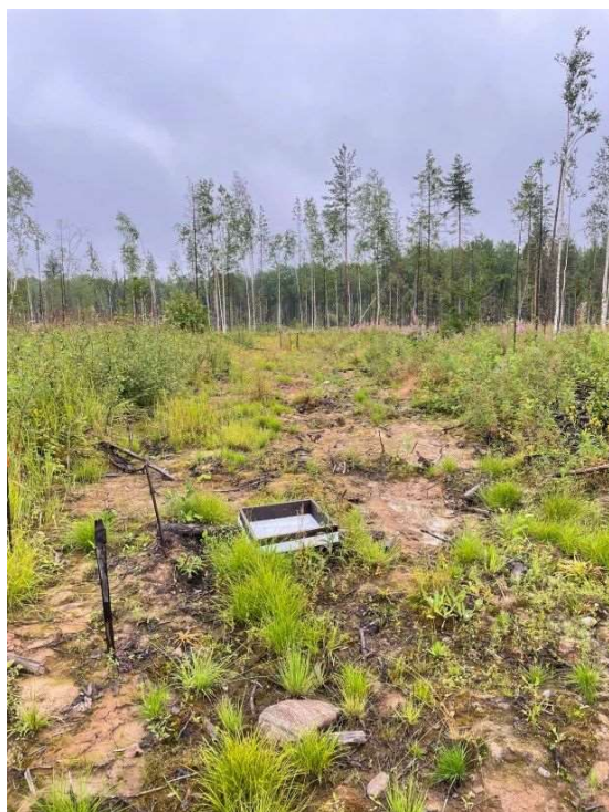
Рис. 2. Внешний вид опадоуловителя на волоке 10Р

Отбор опада производился с помощью 30 случайно расположенных опадоуловителей (ОУ) размером 0,25 \text{ м}^2 . Десять ОУ были установлены в фоновом хвойно-лиственном насаждении, расположенном рядом с вырубкой. Двадцать ОУ на вырубке, причём пять из них установлены на пасечных участках, а 15 на волоках, из которых пять установлены на волоке, на котором было проведено выравнивание колеи, удаление подстилки, пней и порубочных остатков (10Р) (рис. 2). Опад собирали в конце мая 2022–2024 гг. и в конце вегетационных периодов 2021–2023 гг. после осеннего листопада.