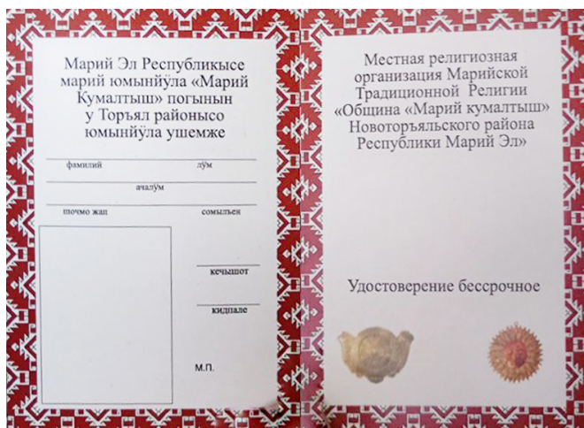
Р и с. 1. Удостоверение марийского карта. Автор изображения Р. А. Саберов

F i g. 1. The Mari priest passport. Image by R. A. Sabarov