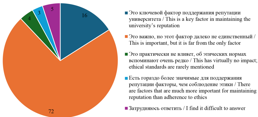
Р и с. 1. Общая оценка влияния соблюдения научно-педагогическими работниками и студентами норм академической этики на репутацию университета, абс. число

И.: И что? Если от этой кражи никто не пострадает, то многие агенты выиграют, это называется “парето”, эффективность, и вы переходите в более эффективную точку, why not? Например, тот человек, у которого списали, ему от этого горячо или холодно?