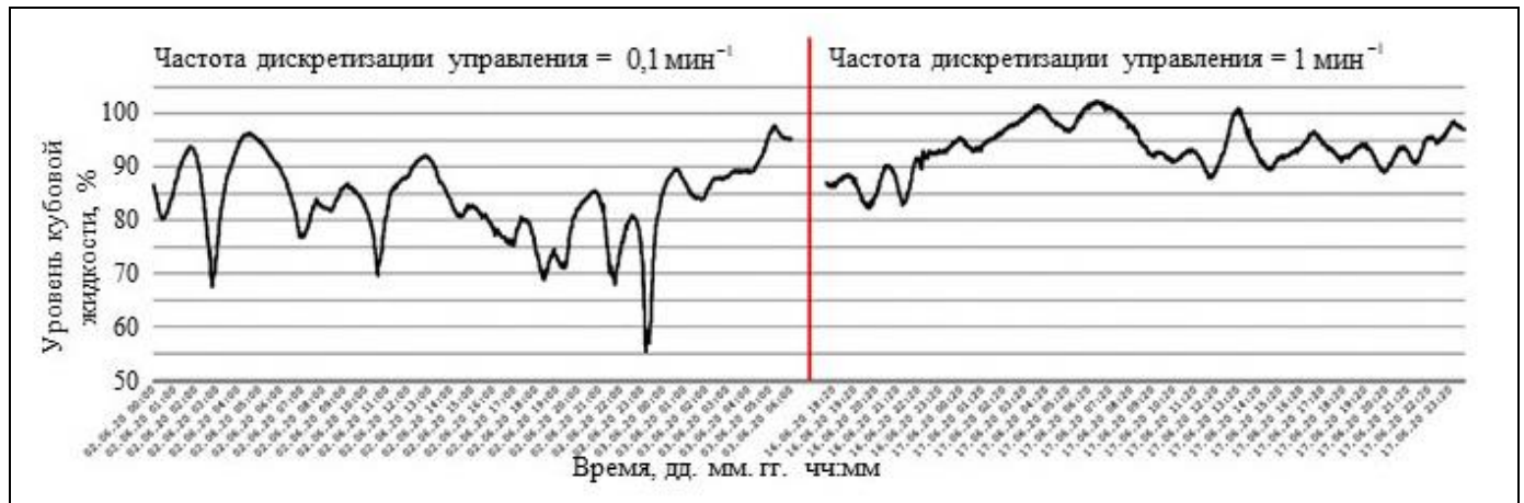
Рис. 4. Уровень кубовой жидкости в кубе К-2