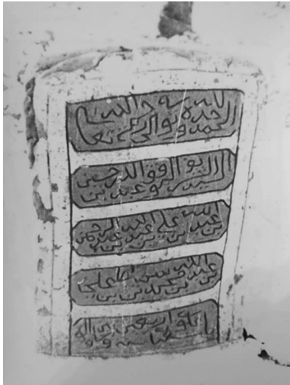
Ил. 5. Фото надгробия, сделанное П.А. Грязневичем в 1988 г. Поселение Қāрат ас-Санāхиджа