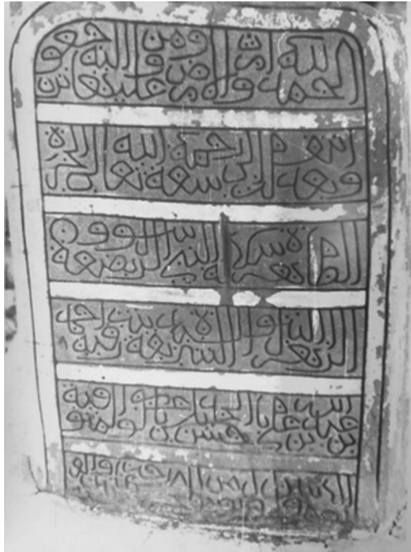
Ил. 3. Фото надгробия, сделанное П.А. Грязневичем в 1988 г. Поселение Қарат ас-Санāхиджа