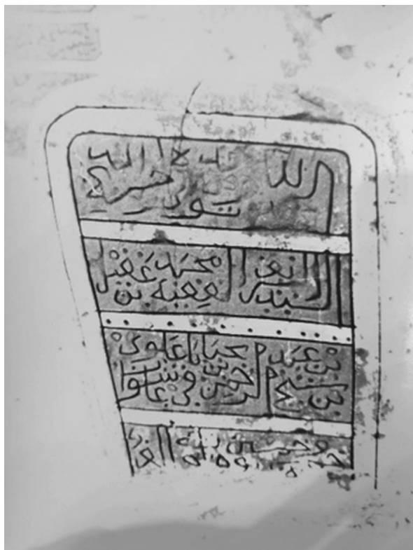
Ил. 8.1. Краткая эпитафия надгробия. Фото, сделанное П.А. Грязневичем в 1988 г. Поселение Қарат ас-Санāхиджа