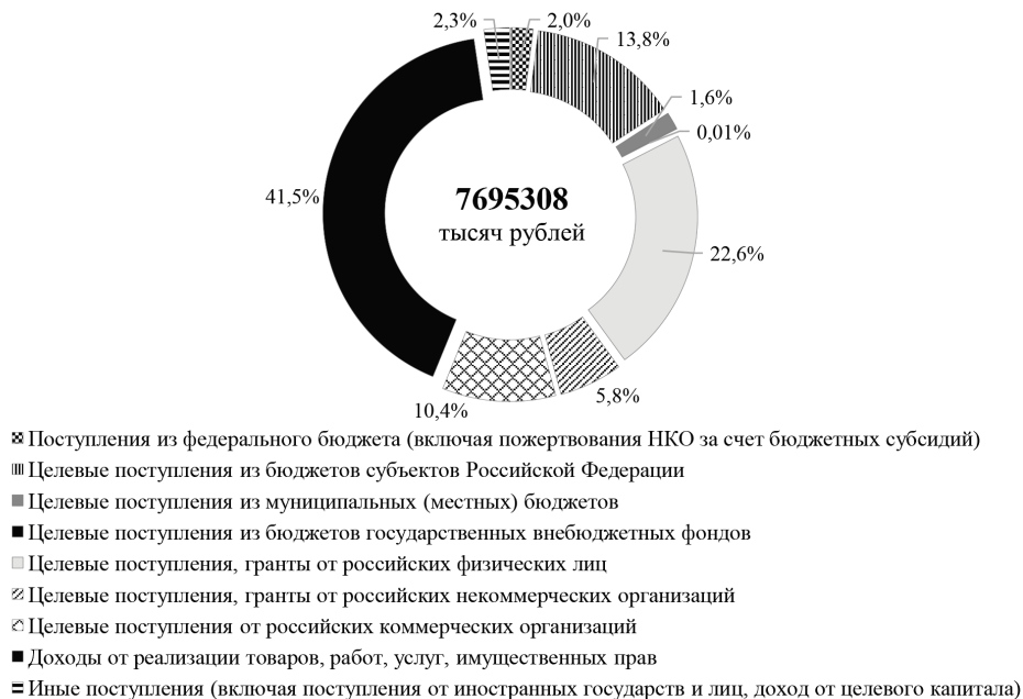
Рис. 1. Структура доходов СОНКО Волгоградской области по итогам 2021 года (в % к итогу)